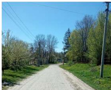
На честь Миколи Петровича Трублаївського (Трублаїні) в Черепівці названо центральну вулицю.

З 1918 по 1928 рр. тут провів свої юнацькі роки письменник Микола Петрович Трублаїні. Він організував хату-читальню, бібліотеку, гурток з ліквідації неписьменності, проводив просвітницьку діяльність поміж селян.