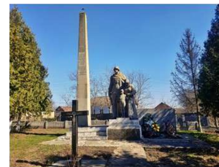
Пам'ятник-обеліск загиблим воїнам-односельцям

З липня 1941 року село Черепівка було захоплене німецько-фашистськими загарбниками. За роки війни окупанти нанесли збитків населенню близько на 1 млн карбованців. У період окупації згоріла школа, повністю знищена сільська бібліотека, приміщення клубу було зруйноване й перетворене в конюшню. Також у мешканців села забрали всю колгоспну й людську худобу.