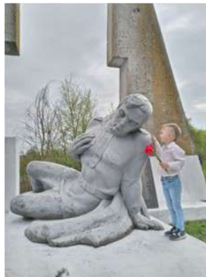
Пам'ятник загиблим у Другій світовій війні

Під час Другої світової війни загинуло 67 осіб. Майже чотири роки село перебувало в неволі. В березні 1944 р. село було звільнене від німецьких окупантів.