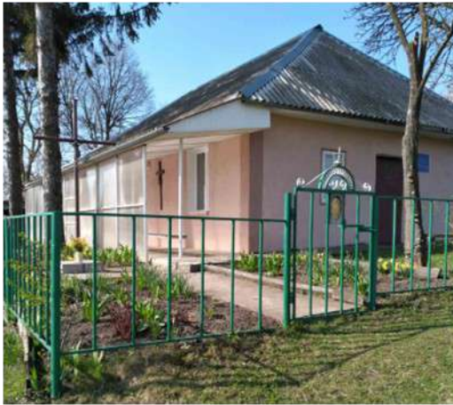
Каплиця Пресвятої Діви Марії Летичівської

А у 2011 році розпочалася реконструкція колишньої колгоспної будівлі в костел Матері Божої Летичівської.