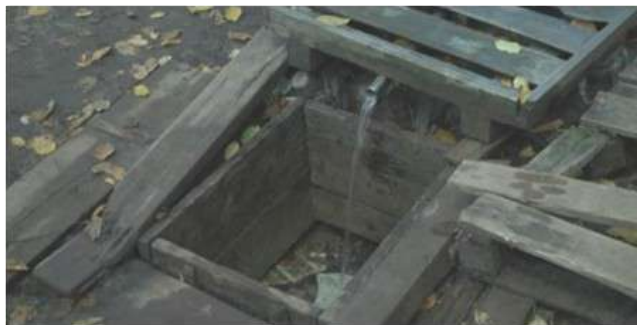
Цілюще джерело Казубок

До недавніх пір текло цілюще джерело, стояла капличка, завжди стояла жива черга людей, аби набрати води. Наразі, на превеликий жаль, струмок висох. Каплички немає, залишився тільки колодязний круг.