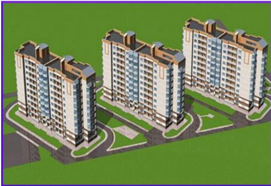
Житловий комплекс «Кедр» по вулиці Лісогринівській

Тут на 45 га розташуються Озерна-2 та Озерна-3 з розвиненою інфраструктурою.