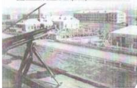
«Шталаг 355» - на дальньому плані видно будівлю штабу 19-ї ракетної дивізії