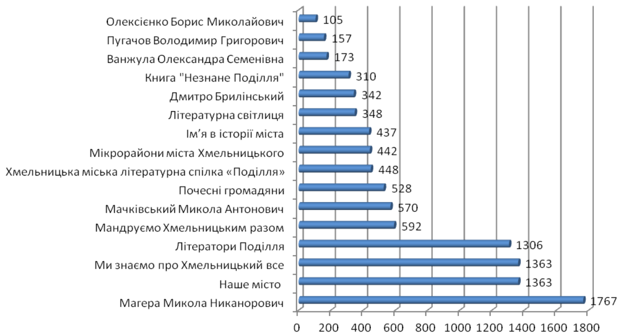
Мал. 1. Рейтинг найпопулярніших краєзнавчих сторінок сайту ЦБС за 2013 рік